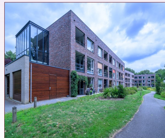
Woonzorgcentrum Theresia - Vughterstede