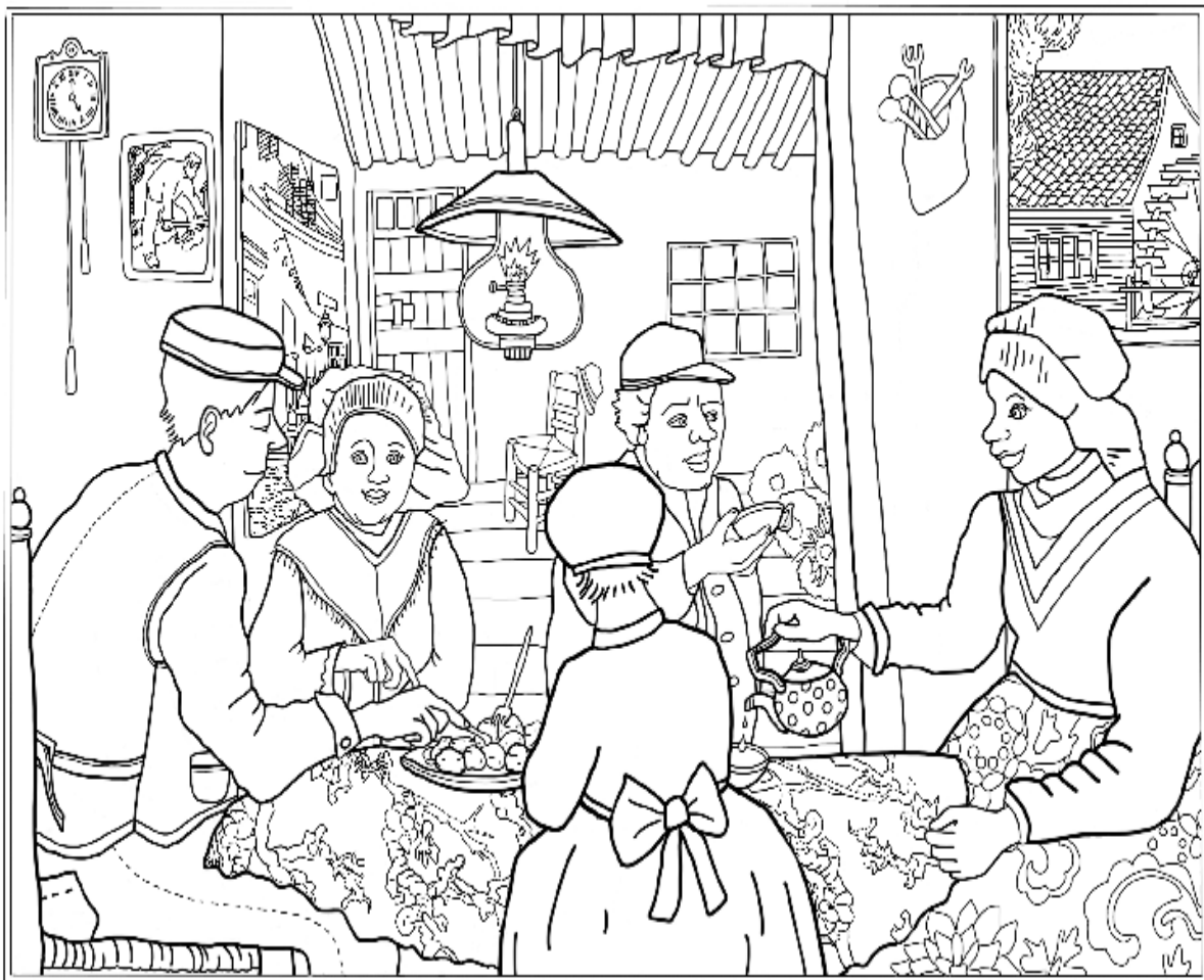
Illustratie van de aardappeleters gemaakt door Saskia van Oversteeg