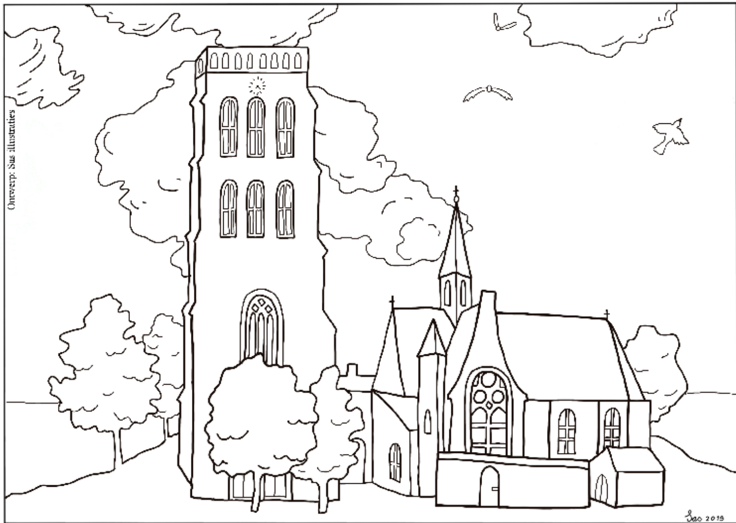
Illustratie van de Lambertustoren door Saskia van Oversteeg