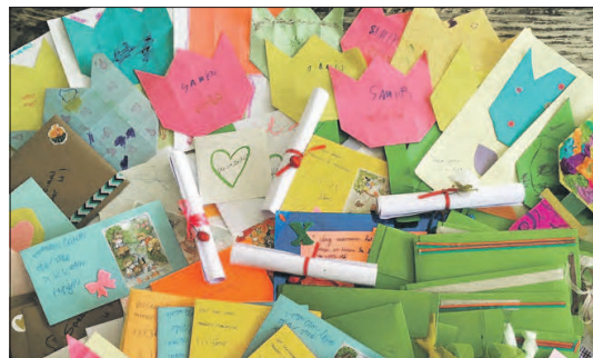
Knutselwerk van kinderen voor bewoners woonzorgcentra.

In Noordost-Brabant hebben de ouderenzorgorganisaties Vughterstede, Brabantzorg, Vivent, VanNeynsel, Laverhof, St. Jozefoord, Schakelring, De Annenborch, Pantein en 't Heem, samen met het Jeroen Bosch Ziekenhuis, de handen ineen geslagen. Zij hebben in Boxtel op locatie Liduina bij Zorggroep Elde Maasduinen een corona-afdeling opgezet voor cliënten met psychogeriatrische problemen die besmet zijn met het coronavirus. Daar worden 8 tot 15 cliënten bij elkaar verpleegd door medewerkers van de samenwerkende zorgorganisaties.